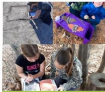
Volet Scolaire Primaire 2e cycle Classe extérieure