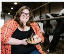
Prix Coup de cœur Étudiant Créateur d'entreprise Fromagerie La Drave