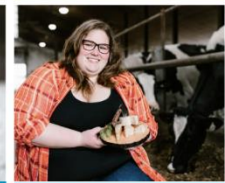
Volet Création d'entreprise Bioalimentaire Fromagerie La Drave