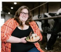
Prix Honneur jeune entrepreneur Fromagerie La Drave