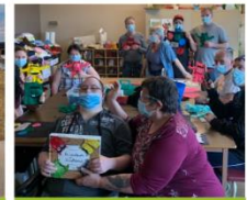
Volet Scolaire Formation prof. et Éducation aux adultes La gestion des émotions