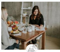
Volet Réussite Inc. Voeux d'amour