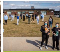
Volet Scolaire Secondaire 2e cycle La retouche Frip'Éco