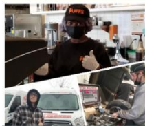
Volet Scolaire Sec. adaptation scolaire Le salon des métiers virtuel