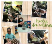
Volet Scolaire Primaire 1er cycle Nectar des colibris