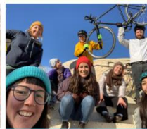
Volet Création d'entreprise Économie sociale Rack à bécik