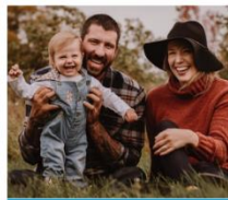
Volet Création d'entreprise - Commerce La ferme Pure Alternative Inc.