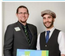
Volet Faire affaire ensemble Horti-Cité