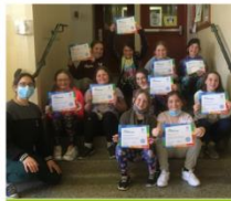
Volet Scolaire Primaire 3e cycle Les supers recycleurs à l'école